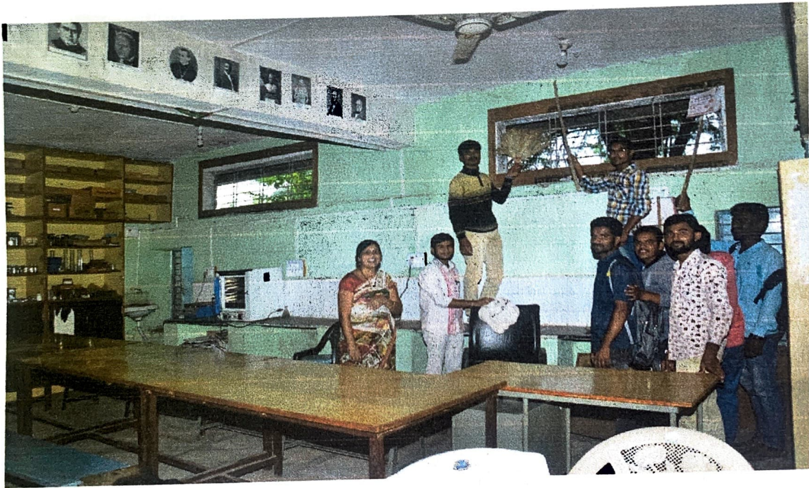
एक दिवशीय संमदान घेण्यात आले.