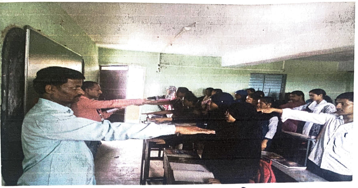
दि. 11 जुलै 2019 रोजी तंबाखू मुक्ती शपथ घेण्यात आली