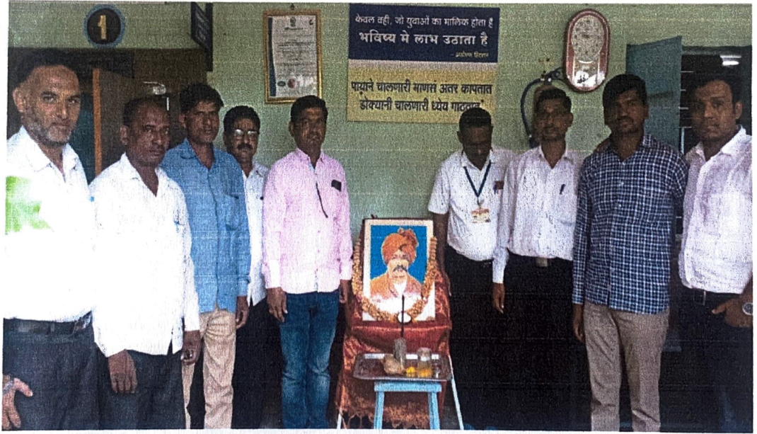
दि. 26/06/2019 रोजी राजर्षी शाहू महाराज जयंती साजरी करण्यात आली.