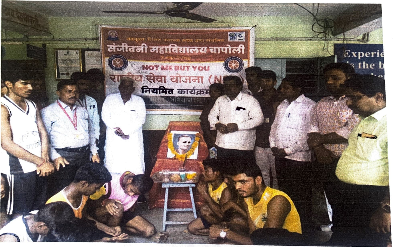
सदृष्ट भारत कार्यक्रम घेण्यात आला.