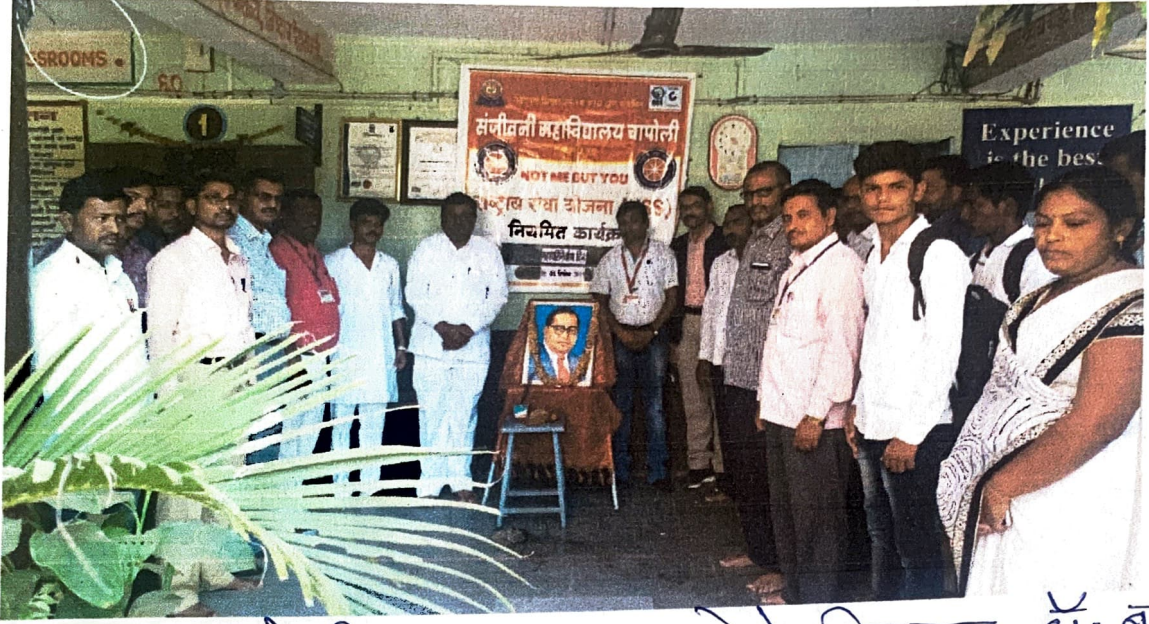
दि. ६।२।२०१९ रोजी भारताच्या ध्येये शिल्पकार डॉ. बाबासाहेब आंबेडकर महापरिनिर्वाण दिन साजरा करण्यात आला.