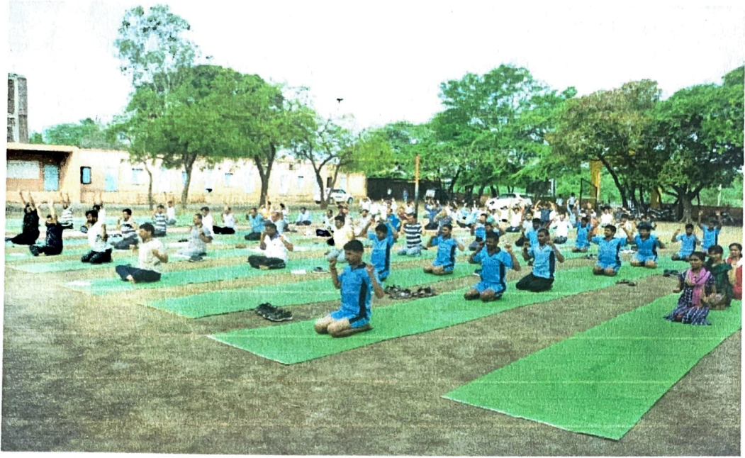
21 जुन 2019 रोजी अंतरराष्ट्रीय योग दिवस साजरा करण्यात आला.