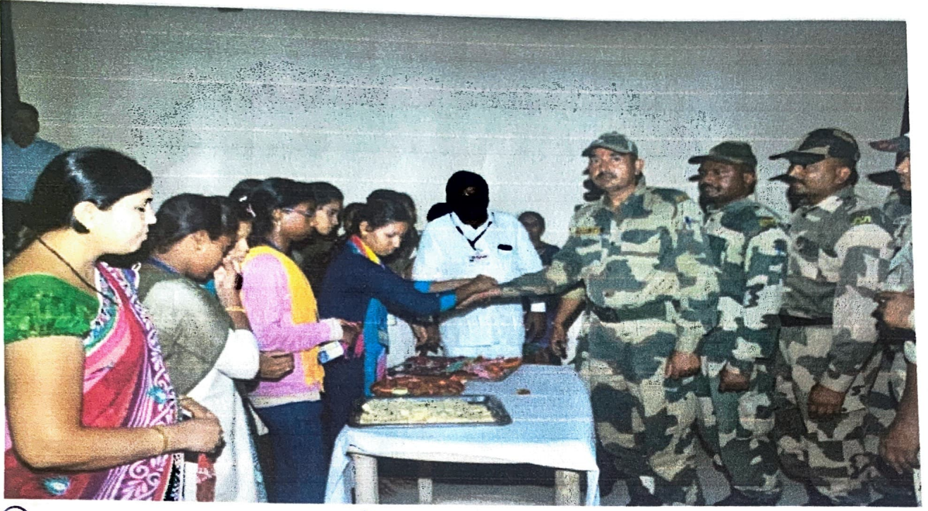
दि. 15 ऑगस्ट 2019 रोजी. रक्षाबंधन सभ साजरा करण्यात आला.