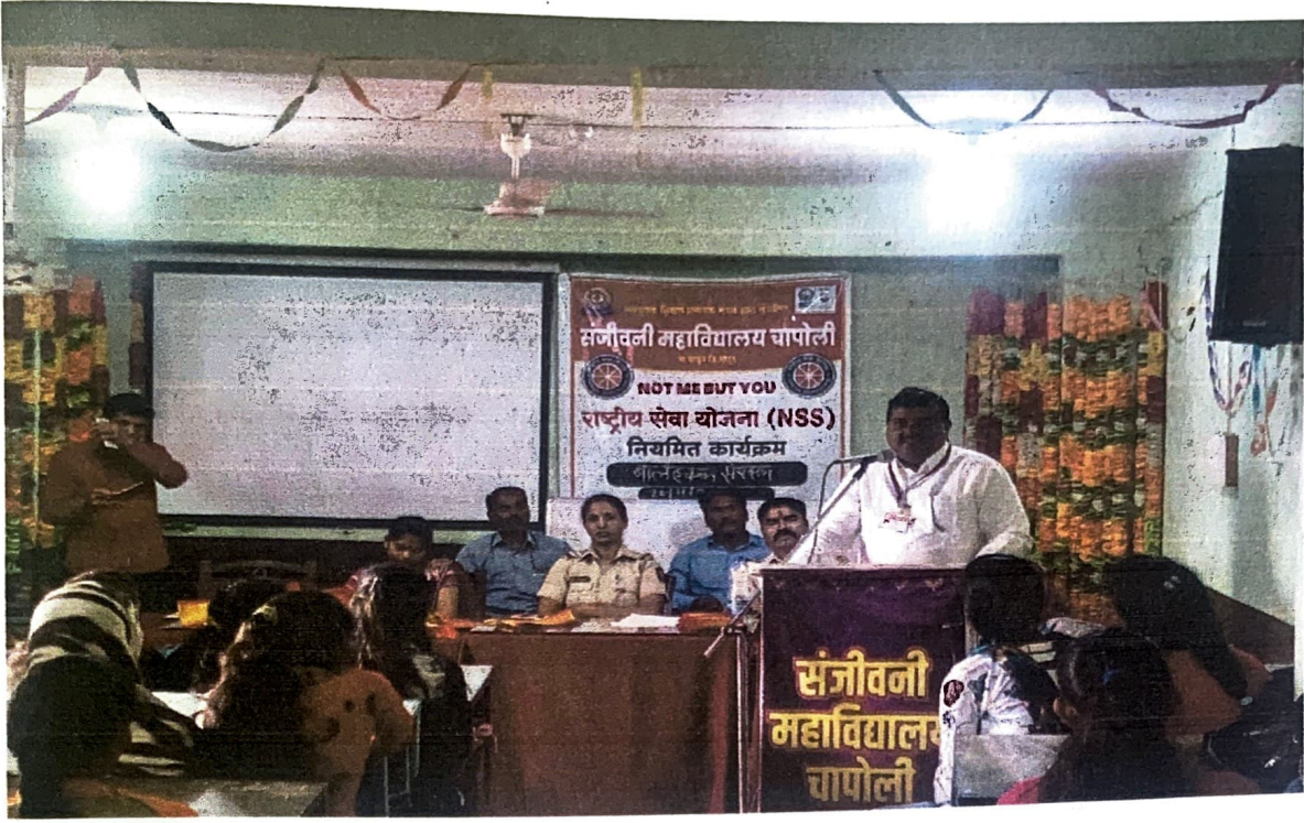
बाल हक्क दिन साजरा करण्यात आला.